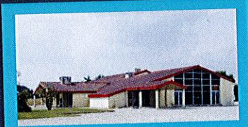
Salle de l'Escale Allée de l'Escale 44680 SAINTE-PAZANNE

AMF 44 ASSOCIATION FÉDÉRATIVE DÉPARTEMENTALE DES MAIRES ET DES PRÉSIDENTS DE COMMUNAUTÉS DE LOIRE-ATLANTIQUE